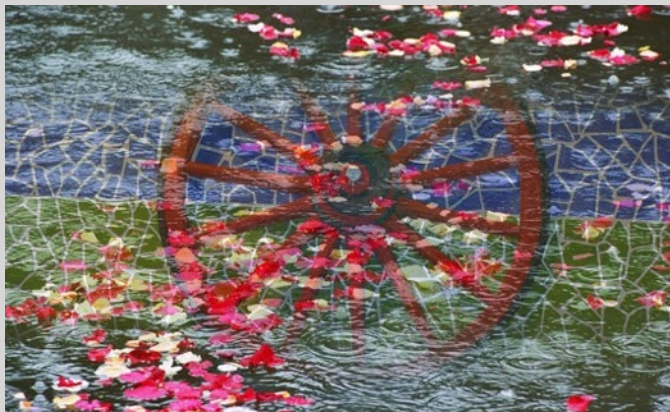
Sastipen Thaj Mestipen – Salud y Libertad

El Pueblo Gitano es la minoría étnica más importante de España, formando parte de la historia de este país desde hace seis siglos; al no existir un censo que recoja este aspecto, es complicado saber el número de españoles gitanas y gitanos, estimado en más de setecientos cincuenta mil.